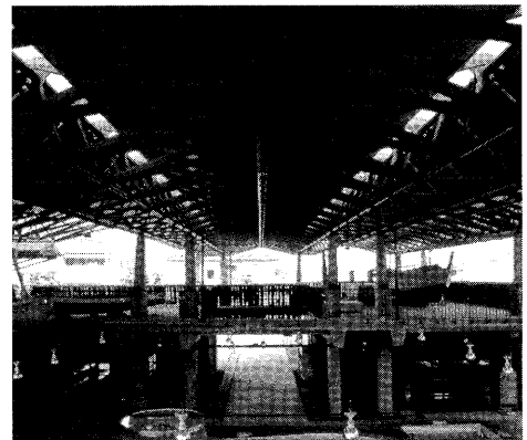
写真上：うしぶか海彩館