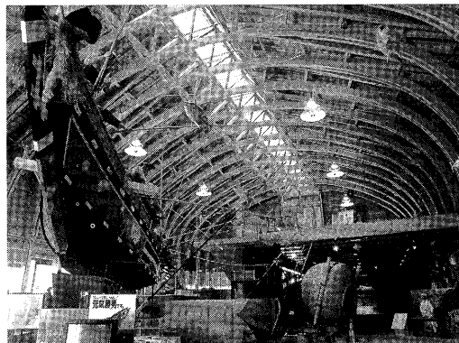
写真下：海の博物館 展示棟A内部