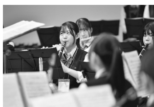
昨年の音楽クリニック