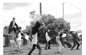
昨年の「まちドラ!」の様子